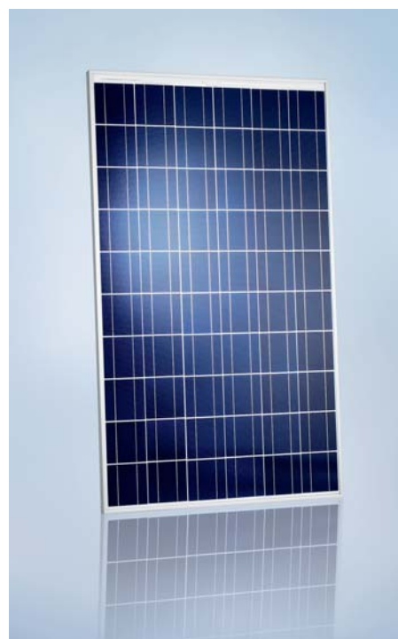
SCHOTT POLY™ 210/217/220/225/230